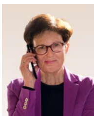
Gudrun Brendel-Fischer Komisař pro integraci bavorské zemské vlády