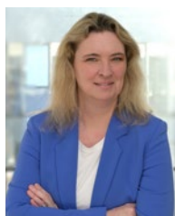
Kerstin Schreyer Bavorský státní ministr pro bydlení, stavebnictví a dopravu