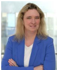
Kerstin Schreyer Bayern İkamet, Yapı ve Trafik Bakanı