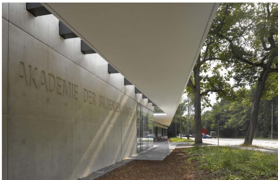
Fassade Bingstraße