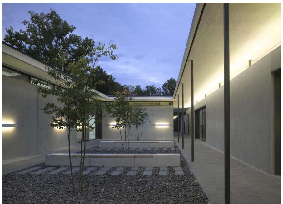
Innenhof BT A