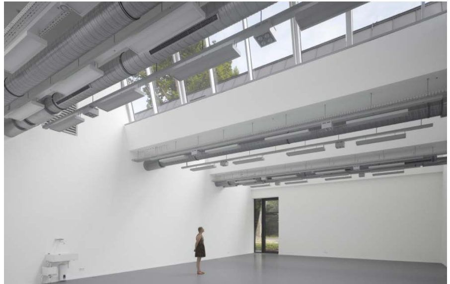
Großer Malsaal