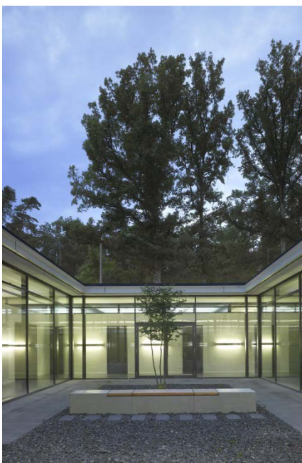
Innenhof BT C