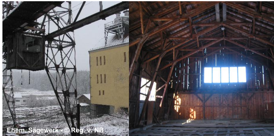
Ehem. Sägewerk

Regierung von Niederbayern Sachgebiet Städtebau